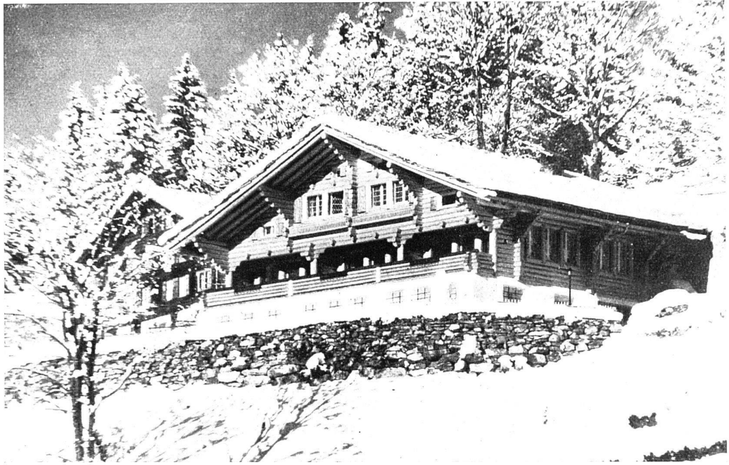
Das Haus des Baumeisters Friedrich Graf in Wengen, Berner Oberland

Ein Haus in Rundholz-Strickbau, von einem Zimmermann aus Leidenschaft für den schönen Baustoff Holz für sich errichtet. Wir bilden diesen einzigartigen, wie der Erbauer selbst sagt, «aus Liebhaberei» erbauten Blockbau nicht als nachahmenswertes formales Vorbild ab, sondern als Beispiel einer handwerklichen Gesinnung und einer Freude am Material, die grösste Hochachtung verdient, und die die Voraussetzung auch für die Ausarbeitung neuer Holzbau-Konstruktionen bildet. (Red.)