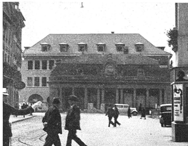
Die alte Berner Hauptwache, oben jetziger, unten früherer Zustand

Wer einigermaßen städtebaulich denken konnte, dem musste von Anfang an klar sein, dass hier der Idealismus wieder einmal auf das falsche Geleise manövriert wurde, weil es nur zwei mögliche Lösungen zur Rettung der Hauptwache gab: entweder alles so zu belassen wie es war und jedenfalls keine grösseren Neubauten dahinter zu errichten, oder das wirklich reizvolle Gebäude abzutragen und weiter aarewärts oder überhaupt auf einem andern Platz wieder aufzustellen. Zu dieser klaren Erkenntnis konnte man sich in Bern nicht durchringen. Man hat die Hauptwache stehen lassen, aber man hat alle die schönen Schutzmassnahmen und beschränkenden Vorschriften bezüglich der Neubauten lautlos und unter der