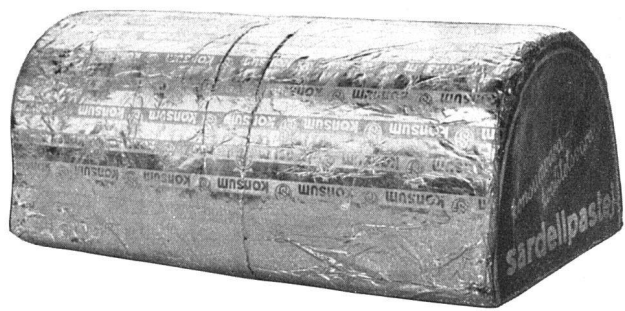
Konserven- och Lebensmittelpackungen der Kooperativen Gesellschaft. Vorbildliche Packungen: einheitlich ohne Schematismus, grafisch gepflegt, ohne kunstgewerbliche Mätzchen, von einer Modernität, die selbstverständlich und nicht gesucht wirkt.