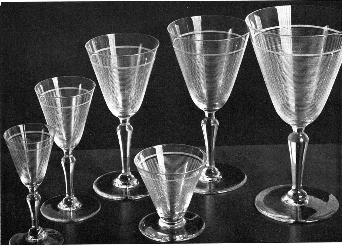
Glasservice von Orrefors-Glashütte