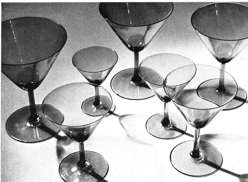
Glasservice von Orrefors-Glashütte