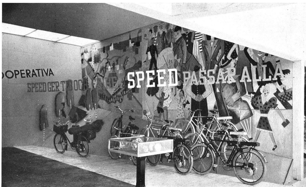
Stand der Kooperativen Gesellschaft