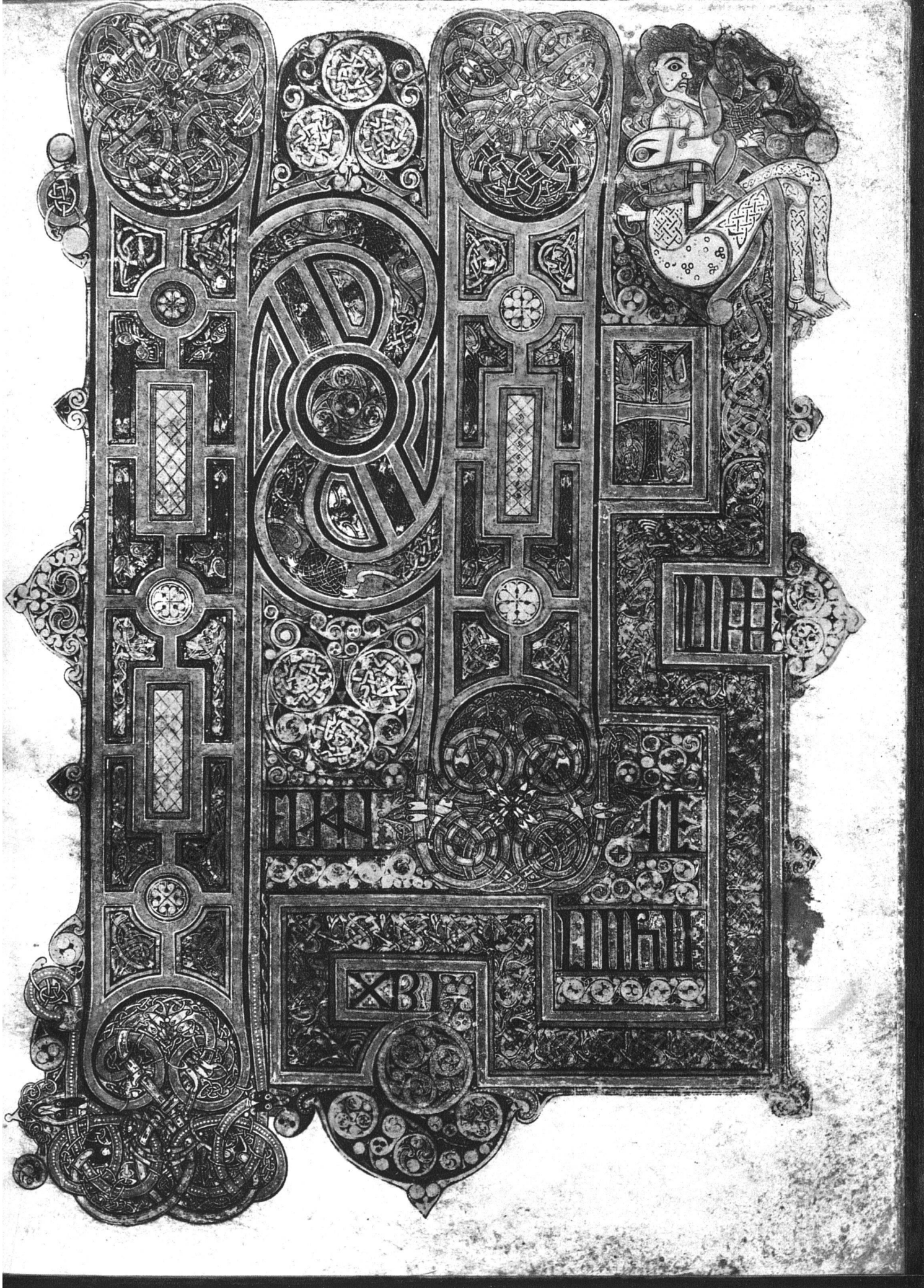
Altirisches Ornament. Initialseite des Markus-Evangeliums aus dem «Book of Kells» im Trinity College, Dublin

«Initium evangelii Jhesu XPI», und zwar INI als grosse kombinierte Initiale, rechts daran angelehnt T, gekreuzt vom liegenden I. Weiterhin im mäanderartig gebrochenen Rahmen: IUM EVAN GE LIIHU XPI. Rechts oben verwandelt sich die Rahmenborte in einen Drachenkopf, der sich mit einem sitzenden Mann verschlingt. Die Kassetierung der Initialenstämme erinnert an die in der gleichen Zeit geübte Zellschmelz- und Filigrantechnik. Die Initialenkonturen