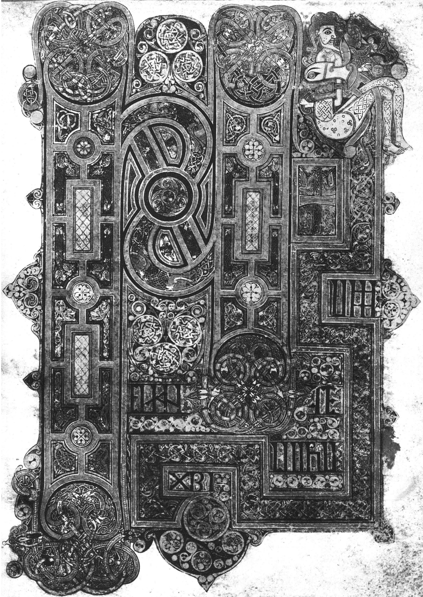
Altirisches Ornament. Initialseite des Markus-Evangeliums aus dem «Book of Kells» im Trinity College, Dublin

«Initium evangelii Jhesu XPI», und zwar INI als grosse kombinierte Initiale, rechts daran angelehnt T, gekreuzt vom liegenden I. Weiterhin im mäanderartig gebrochenen Rahmen: IUM EVAN GE LIIHU XPI. Rechts oben verwandelt sich die Rahmenborte in einen Drachenkopf, der sich mit einem sitzenden Mann verschlingt. Die Kassetierung der Initialenstämme erinnert an die in der gleichen Zeit geübte Zellschmelz- und Filigrantechnik. Die Initialenkonturen