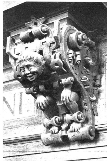
Türkonsole im Rittersaal des Schlosses Marburg

lerei in ihren Bildern erarbeitet hat, sie werden die ästhetische Seite der Architektur intensiver und mutiger in Arbeit nehmen als heute.