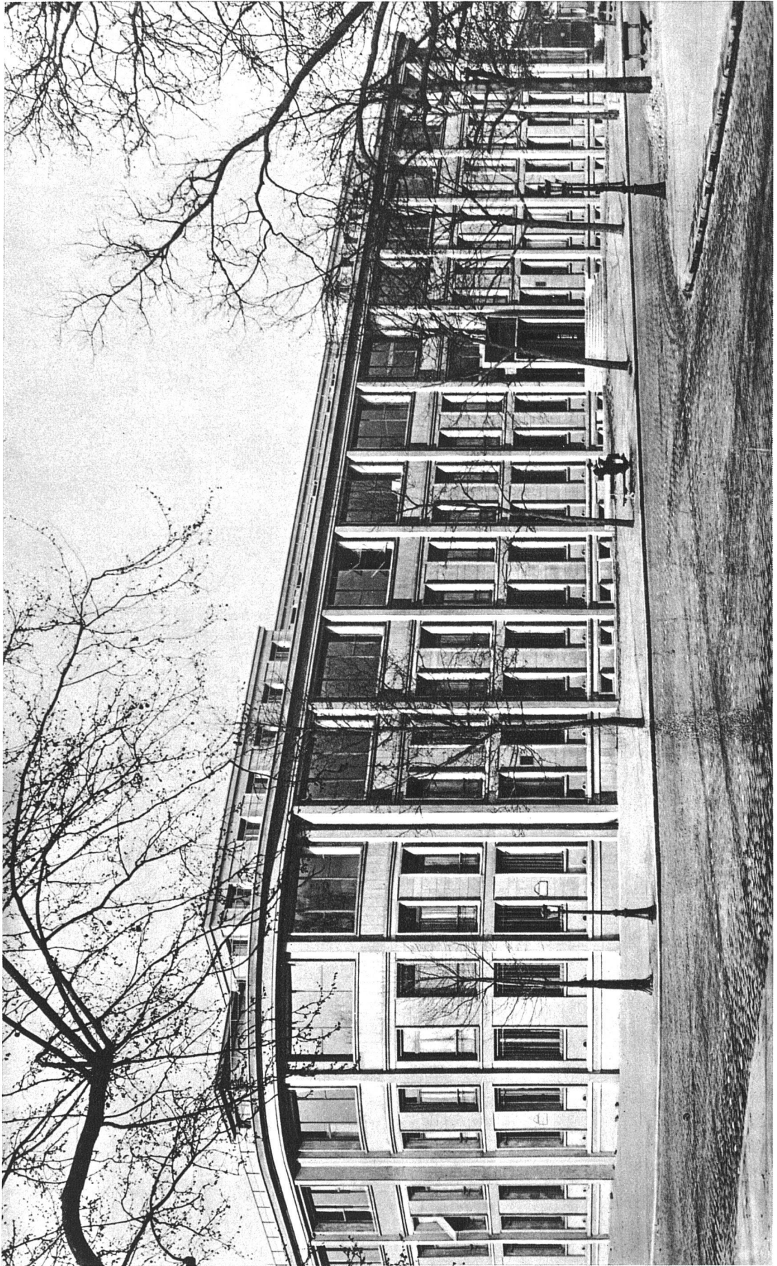
A. und G. Perret, Architekten, Paris. Marinebauamt. Nordseite