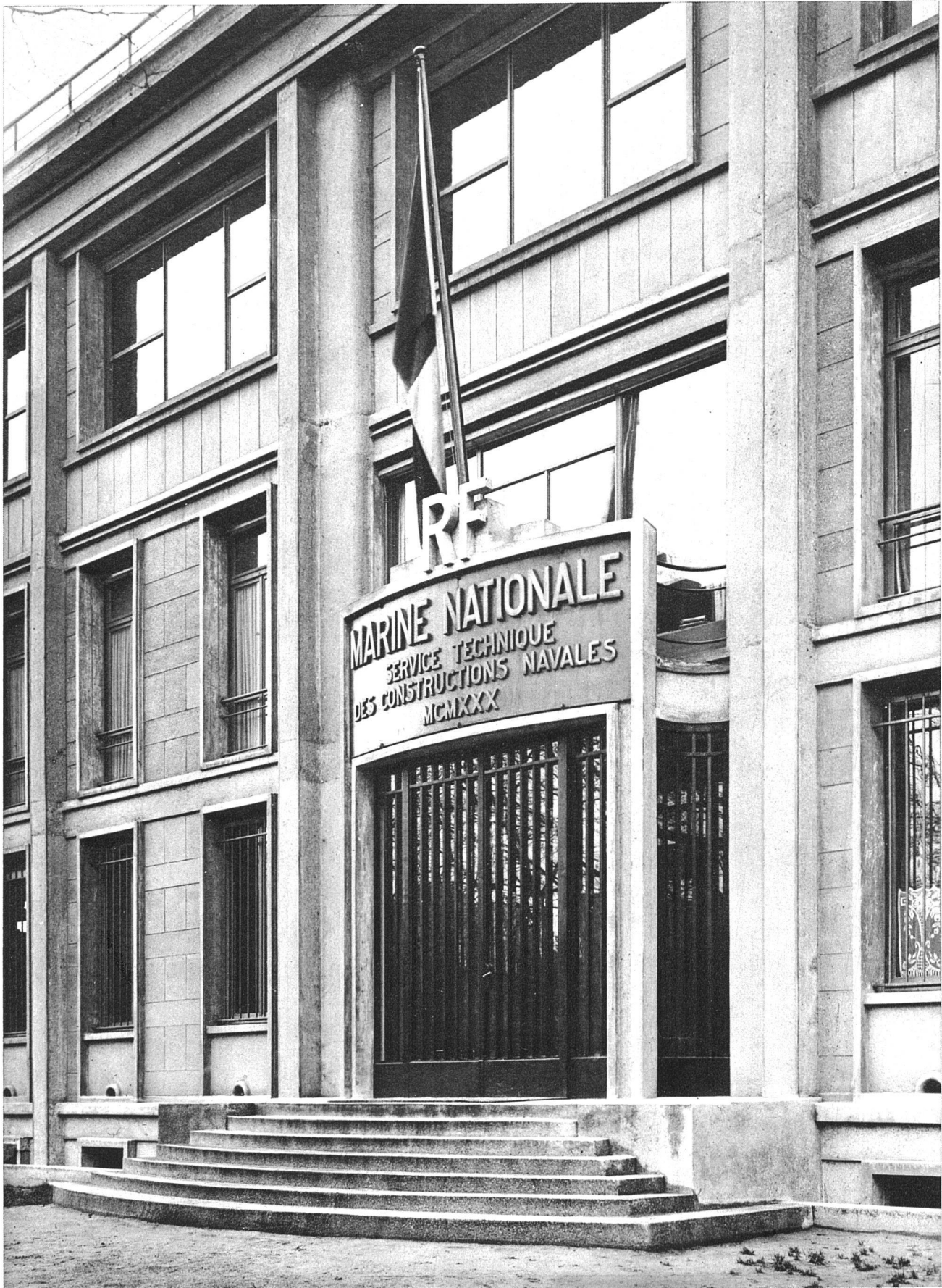
A. und G. Perret, Architekten, Paris. Marinebauamt, 1930, Hauptportal