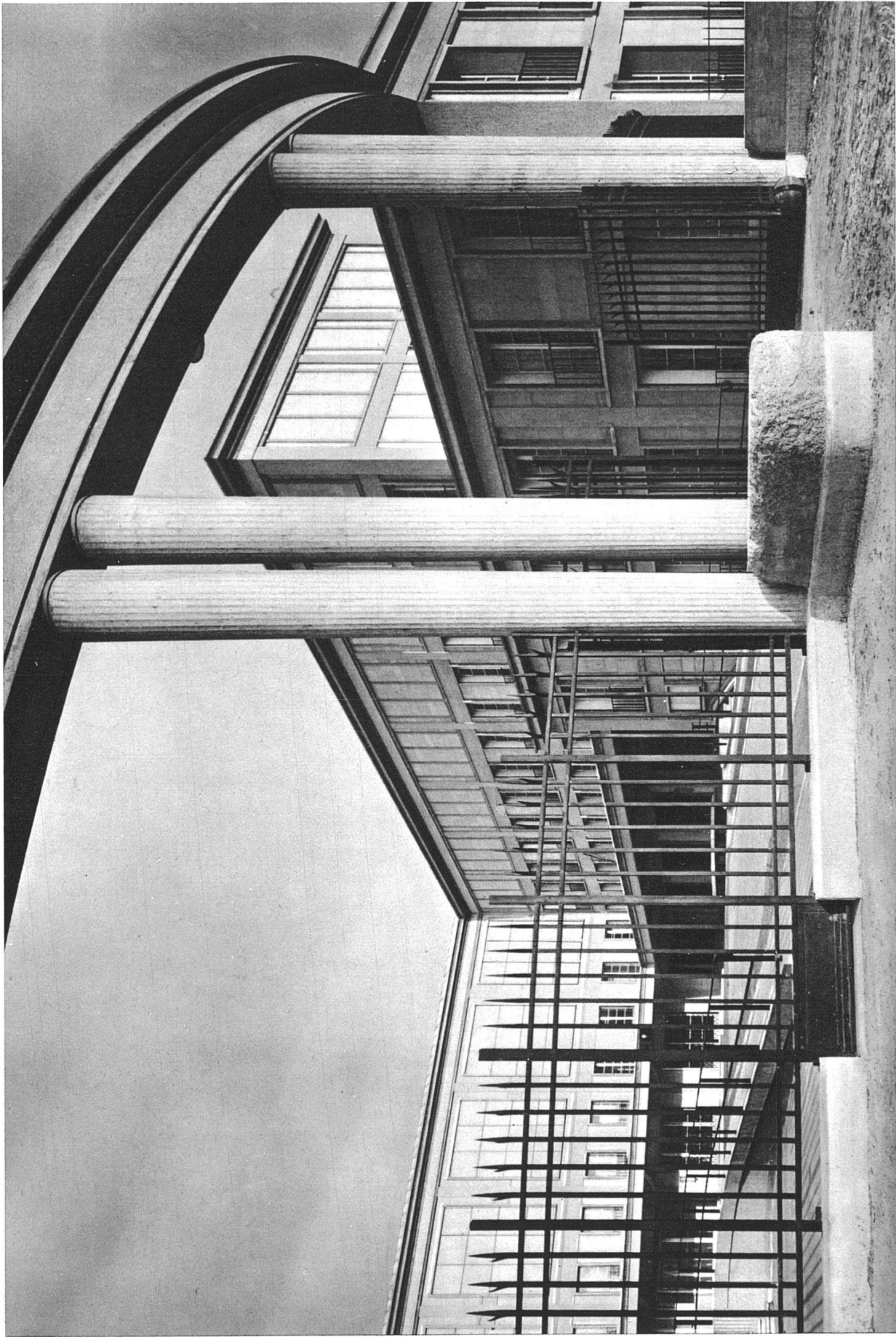
A. und G. Perret, Architekten, Paris. Staatliches Möbelmagazin, 1934 (Hôtel du Mobilier National)