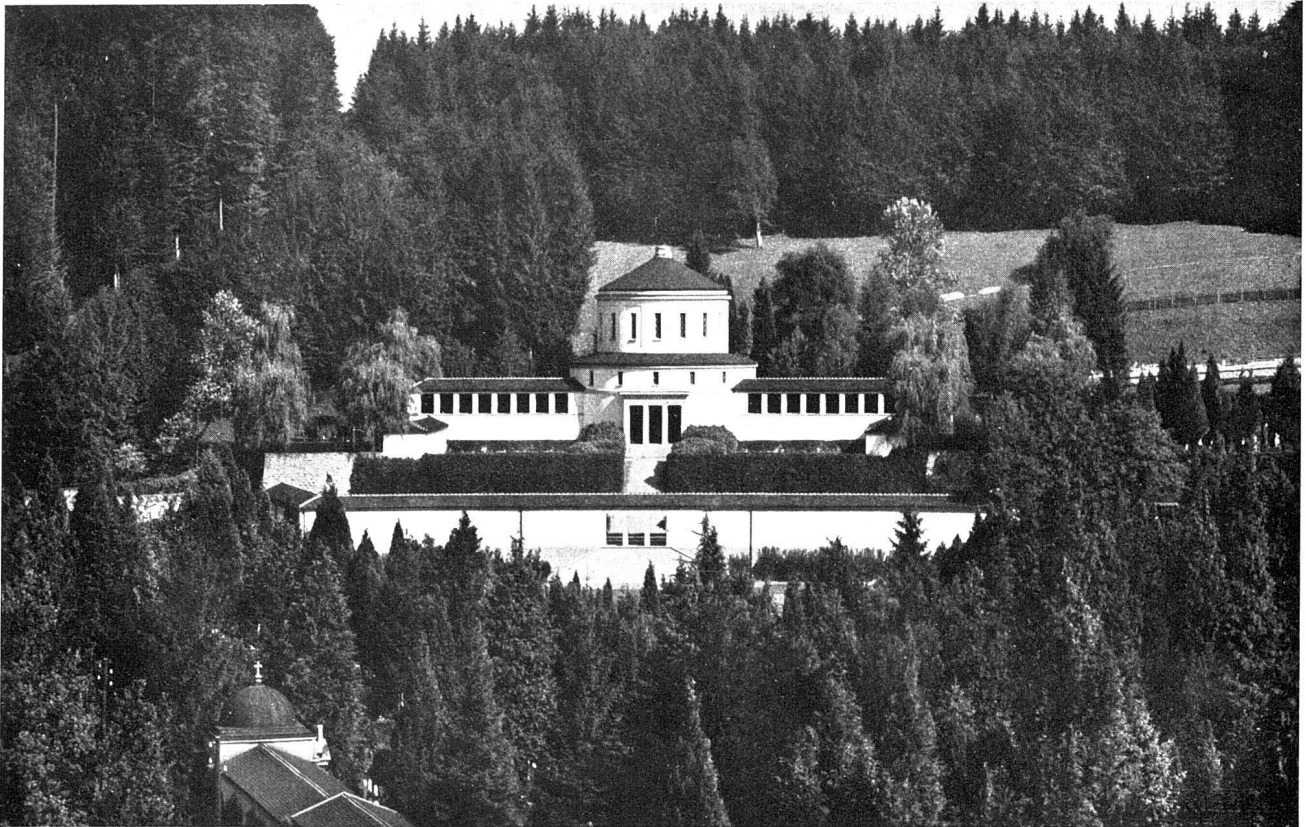
Urnenfriedhof vor dem Krematorium Luzern Architekt Albert Frölich BSA, Zürich

Vom Friedhof «Friedental» gesehen, bildet die neue breitgelagerte Halle eine sehr wirkungsvolle Widerlagerung des Zentralbaus, wobei die ganze Anlage geschickt in eine hervorragend schöne landschaftliche Situation eingefügt wurde