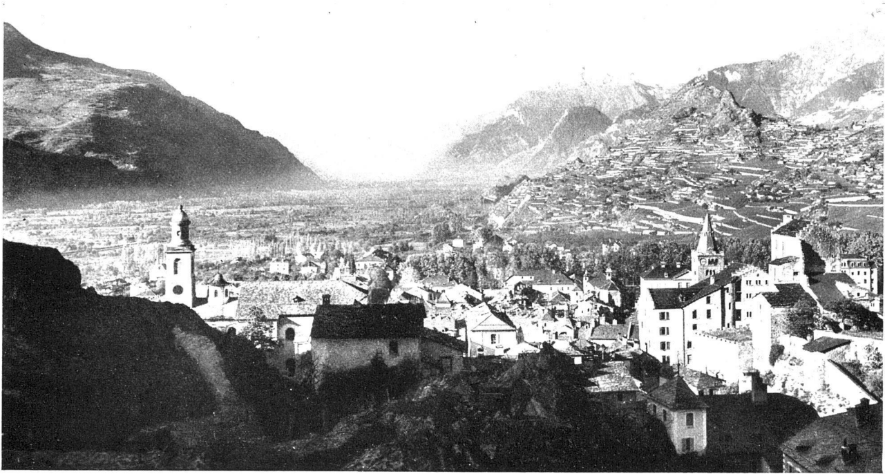
Sitten, vom Schloss Valeria gesehen Mitte: Sitten, Schloss «La Majorie» unten: «Château du Muzot» bei Siders, wo Rainer Maria Rilke seine letzten Lebensjahre als Gast des Besitzers verbrachte

Kirche von Raron und die von Visp sind eben keine «Bürgerhäuser».