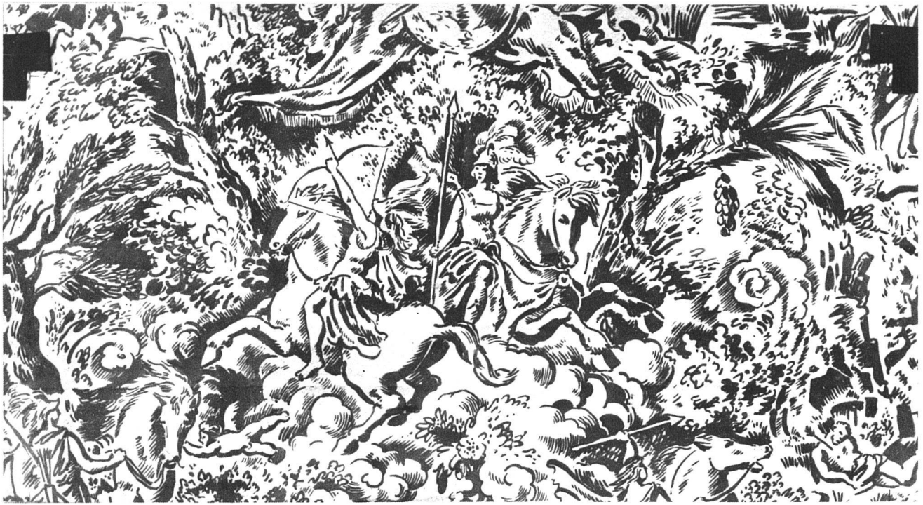
«Le Combat des Amazones», dessin de J.-L. Gampert

Papiers peints genevois de H. Grandchamp & Co., Genève