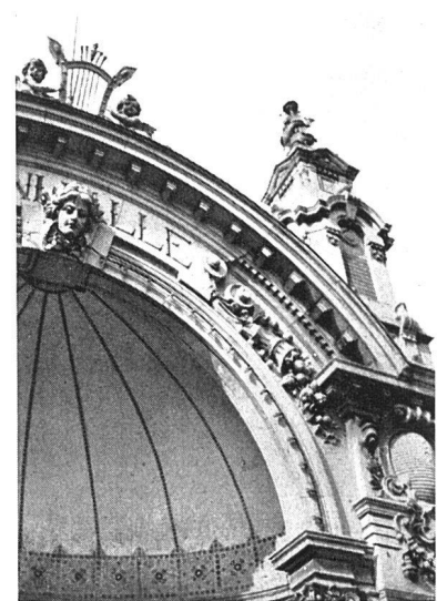
Alte Tonhalle, erbaut 1893—95 von Fellner & Hellmer, unter Benützung von Wettbewerbsentwürfen von G. Frentzen (Aachen) und Bruno Schmitz und G. Braun (Berlin)

technischer Kräfte und in Verbindung gebracht mit den geistigen Strömungen und gesellschaftlichen Stimmungen der Zeit. Eine ernsthafte Arbeit von weitem Blick