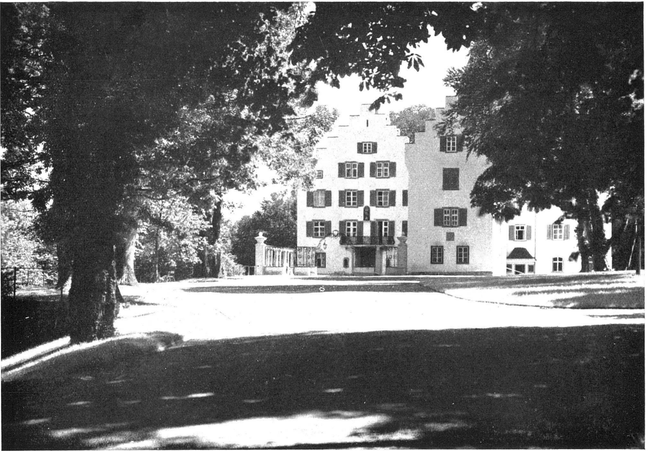
Schloss Wartegg, Staad. Erbaut 1557 von einem Blarer v. Wartensee

«Das Bürgerhaus in der Schweiz», Band XXIX, Kanton St. Gallen, II. Teil