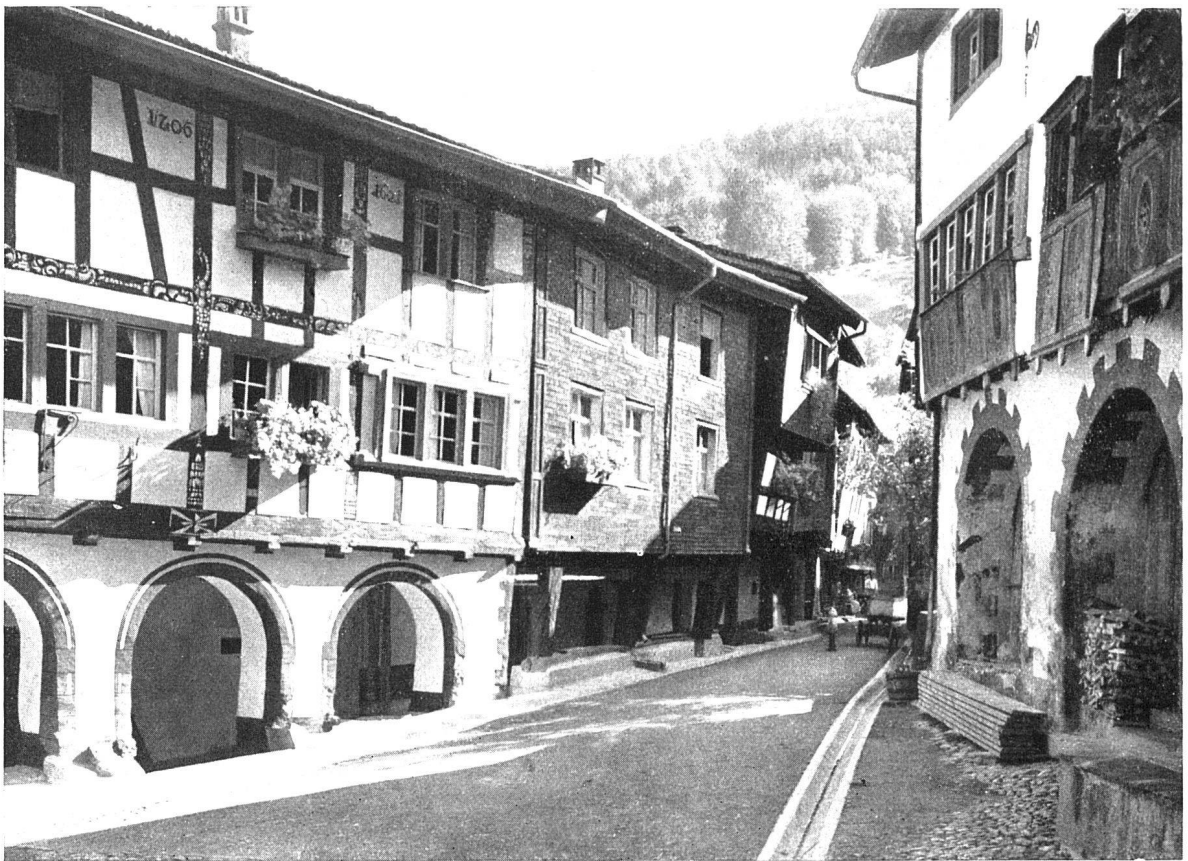
Werdenberg, Hauptstrasse. In dieser Art hat man sich die Strassen auch der grössten Städte noch des XIV. Jahrhunderts vorzustellen

«Das Bürgerhaus in der Schweiz», Band XXIX, Kanton St. Gallen, II. Teil Seite 381 oben: Stadt und Schloss Rapperswil am Zürichsee, gegründet Anfang des XIII. Jahrhunderts unten: Städtchen und Schloss Werdenberg im St. Galler Rheintal