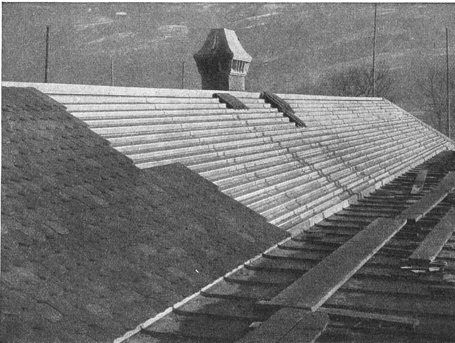
Altersasyl in Näfels Eternitrippen-Unterdach Architekt H. Lampe, Näfels

Eisenwerk Klus, Klus (Solothurn) Abteilung für Zentralheizung Gesellschaft der Ludw. von Roll'schen Eisenwerke