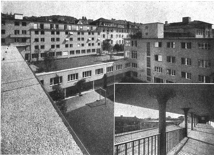
Schweizerische Pflegerinnenschule Zürich Terrassen- und Dachbeläge mit Asphalt- Gewebeplatten «Mammut» Architekten Gebr. Pfister, Zürich

Auf Anfrage stehen wir mit allen Auskünften gerne zur Verfügung Telephon 41.211