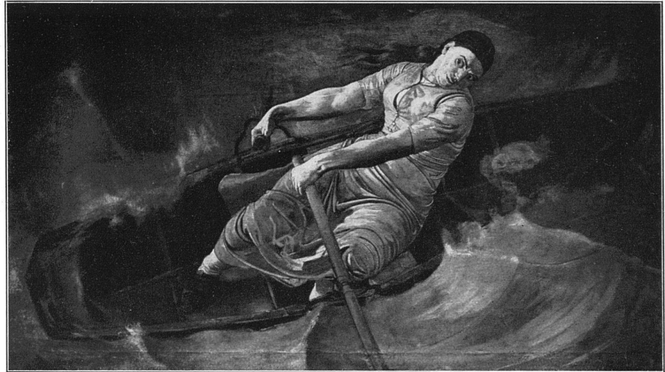
«Das mutige Weib» Basel, Kunstmuseum 0,98 × 1,70 m, 1886

Hodlers die ungewöhnliche und für den mit Zäsuren rechnenden Historiker sehr erschwerende Stetigkeit. Es existieren Bilder aus der Mitte der 70er Jahre, also aus seiner frühesten Zeit, die man ohne Mühe und grosse Schulung als Hodler bestimmen würde, auch wenn man nur etwa reife expressionistische Werke der 90er Jahre kannte; ich erinnere beispielshalber an den «Schüler» im Basler Museum. Durch diese Stetigkeit ist es sehr schwer, den «Anfang» der expressionistischen Phase, wenn von einem solchen überhaupt gesprochen werden darf, zu erkennen. Wir werden noch sehen, dass diese keineswegs belanglose Bestimmung nicht unmöglich ist. Da die expressionistische Phase ohne Bruch, also sehr leicht einsetzt, geschieht dieses Einsetzen ungewöhnlich früh.