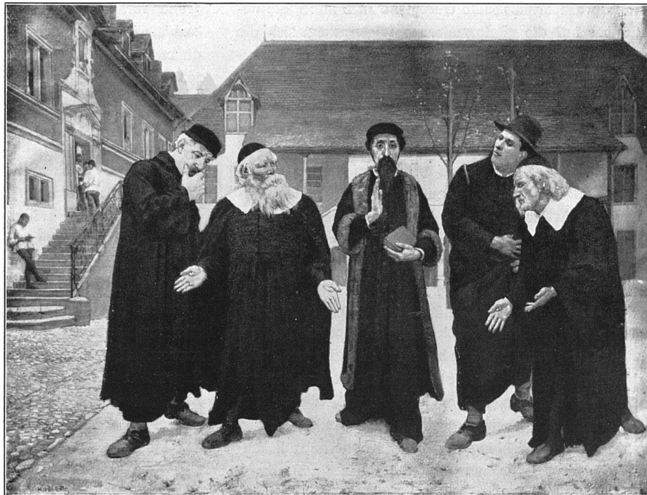
«Die Reformatoren» Genf, Musée d'Art et d'Histoire 1,005 × 1,305 m, 1883/84