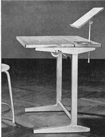
Zeichentisch aus Stahlrohr und verstellbarer Tischplatte mit Vorrichtung zum Abstellen der Vorlagen. Der Tisch eignet sich sowohl für das Freihandzeichnen, als auch für das geometrische Zeichnen