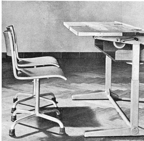
Zürcher Schultisch, Mod. B, für das 4.–9. Schuljahr. Flach und relief stellbare Tischplatte für den Unterricht nach dem Arbeitsprinzip (zeichnen, kleben, schneiden, modellieren usw.). Tischplatte in der Höhe verstellbar, dadurch Anpassung an die Schülergrösse; Wegfall der jährlichen Mobiliarumstellungen. Tischplatte mit zwei Bücherklappen aus Eichenholz, lackiert. Gestell Vierkantstahlrohr metallgespritzt