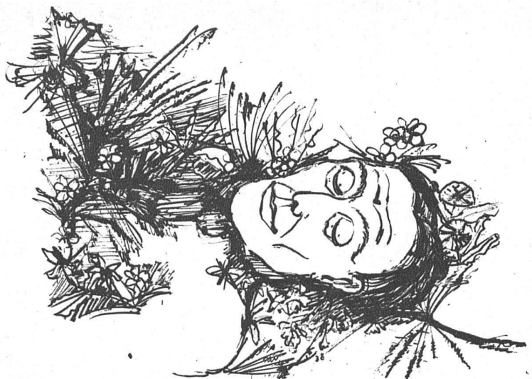
Ch. Laely, Davos Der tote E. L. Kirchner Federzeichnung