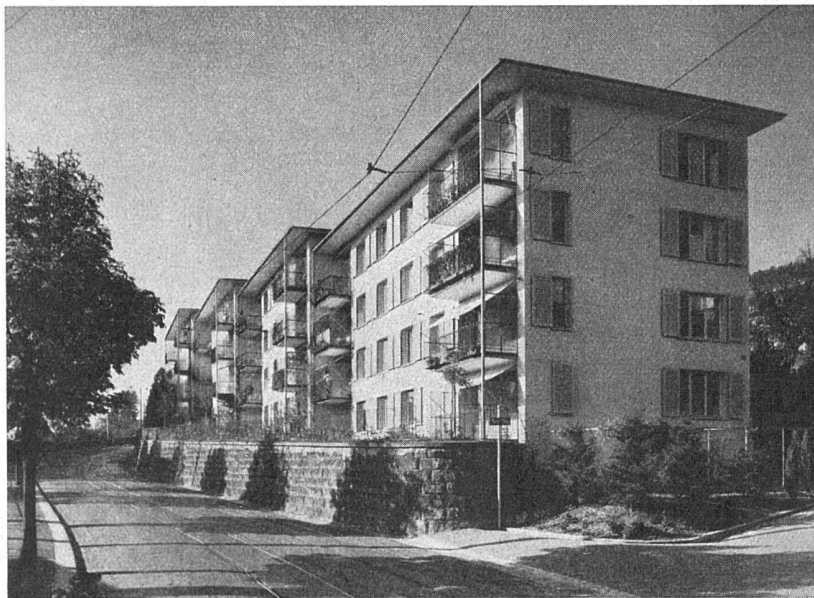
Wohnkolonie Oeristeig, Zürich Allgemeine Baugenossenschaft Zürich Arch.: Kellermüller & Hofmann, Zürich

Flachdächer, ca. 1500 m 2 , mit teerfreier Dachpappe «Turicum» der Asphalt- Emulsion A.-G., Zürich, ausgeführt durch die Genossenschaft für Spengler-, Installations- und Dachdecker- arbeit, Zürich 4