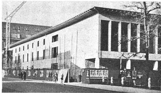
Basler Bauchronik (vergl. den Text auf Seite XIV des Juliheftes)

In diesem Bändchen der Sammlung Göschen gibt der Erbauer des Wiener Stadions sowie der Hochbauten der Nürnberger Stadien usw. eine zusammenfassende Darstellung von Sportbauten, Amphitheatern und Bädern von der Antike bis zur Gegenwart, nebst allen wünschbaren Massangaben im ganzen und einzelnen: ein nützliches kleines Handbuch für Behörden, Sportvereine und Architekten.