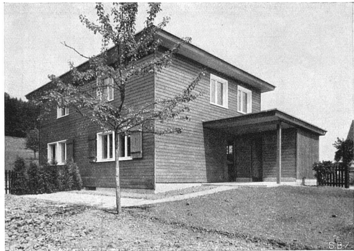
Südostecke, rechts Schopf und Sitzplatz Zweifamilienhaus in Holzbau, Typ B der Grundrisse Seite 56

Siedlungen aus Holzhäusern Musterhaus der Holzhausiedlung Bruggwaldstrasse, St. Gallen Erbaut April/Mai 1937