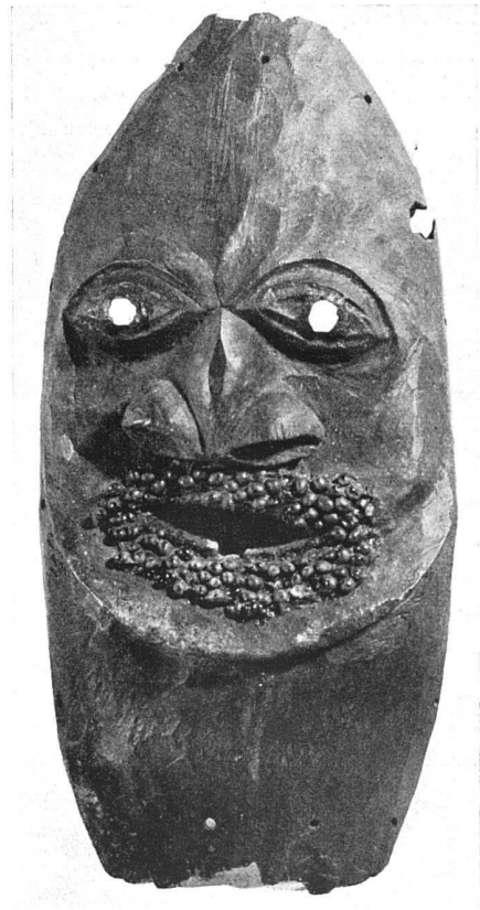
Holzmaske aus Neu-Caledonien