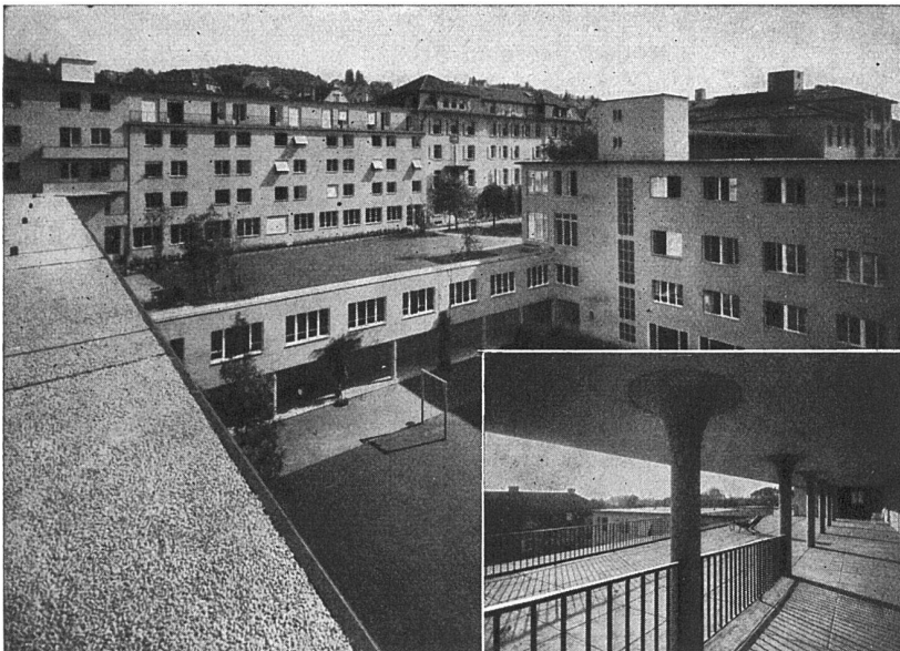
Schweizerische Pflegerinnenschule Zürich Architekten: Gebr. Pfister, Zürich Flachdach- und Terrassenbeläge ca. 4700 m 2 , ausgeführt durch die Asphalt-Emulsion A.-G., Zürich

Asphalt-Emulsion A.-G., Zürich Löwenstrasse 11 Telefon 5 88 66 Dachpappenfabrik und Unternehmung für wasserdichte Beläge