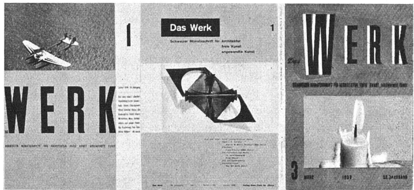
Abgebildet: Der Entwurf im zweiten und die beiden im dritten Rang; der Entwurf von Eidenbenz ist ausgeführt

Zu diesem unter Mitgliedern des BSA und SWB ausgeschriebenem Wettbewerb sind 16 Sendungen mit im ganzen 38 verschiedenen Entwürfen oder Varianten eingelaufen. Eine fulminante Lösung, die auf den ersten Blick überzeugt hätte, war nicht darunter, dagegen verschiedene sympathisch-saubere typografische Arbeiten, unter denen die Wahl schwer war. Das Ergebnis: 1. Rang (250 Fr.) und Ausführung mit einigen Aenderungen: Hermann Eidenbenz SWB, Basel; 2. Rang (100 Fr.): Karl Sternbauer SWB, Zürich; 3. Rang ex aequo (je 50 Fr.):