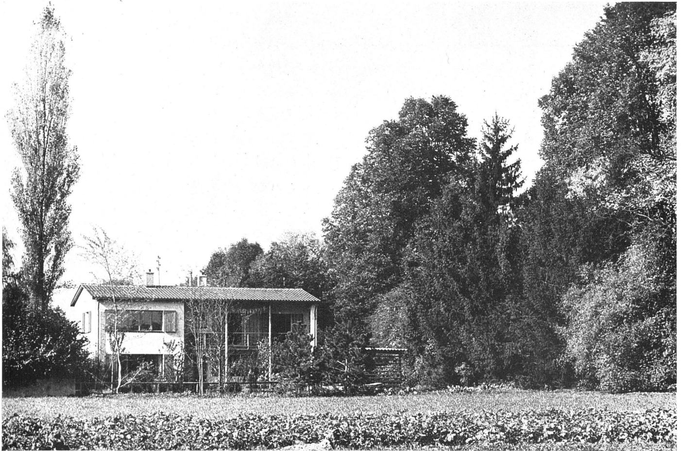
Wohnhaus Dr. M. B. in Bümpliz, Bern , erbaut 1937 Hans Brechbühler, Architekt BSA, Bern