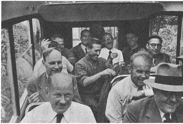
Im Postauto durchs Mendrisiotto