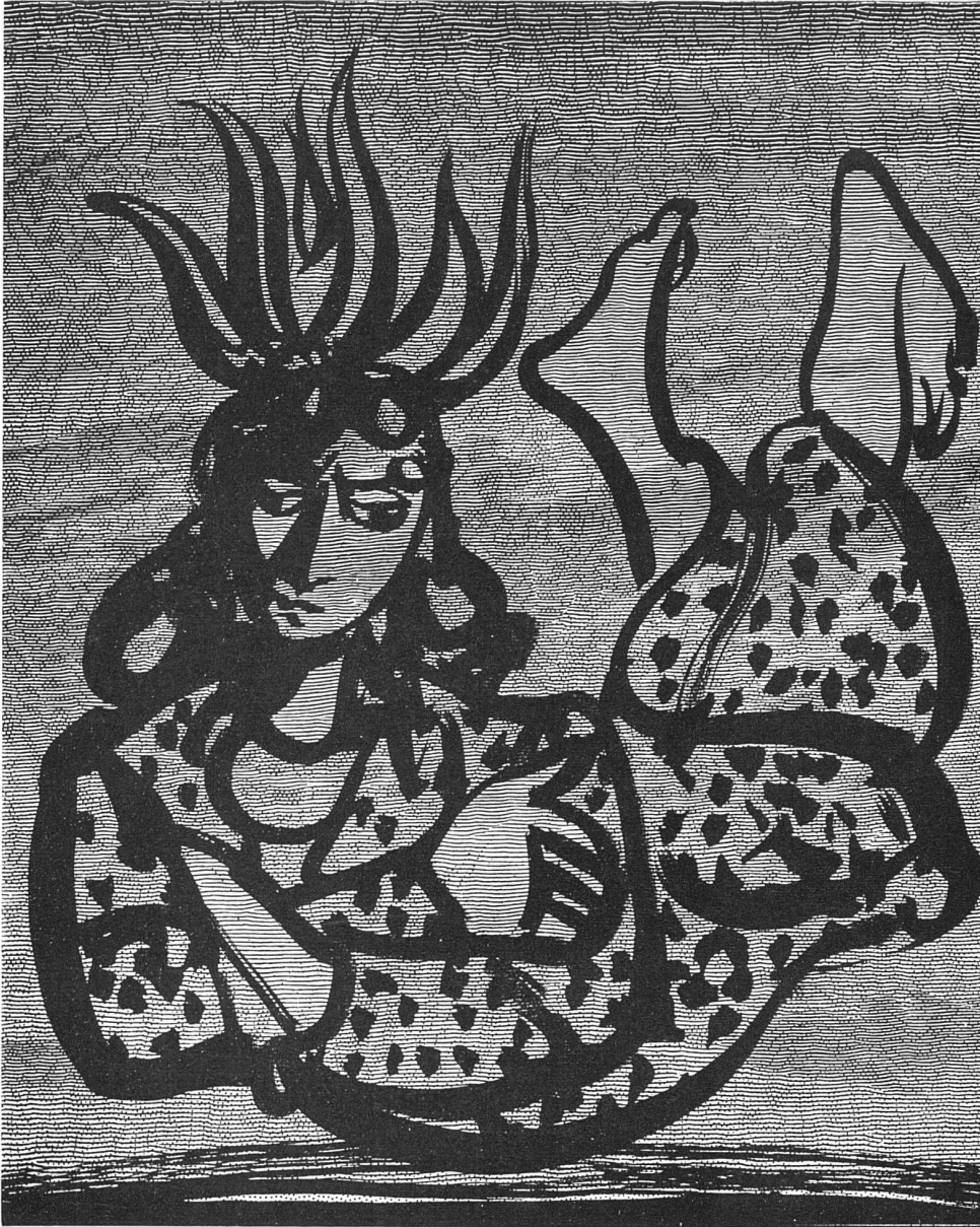
«Thyl Ulenspiegel» von Charles de Coster, mit 63 Zeichnungen von Max Hunziker, erscheint im Januar 1941 im Verlag der Büchergilde Gutenberg, Zürich. 17,5 × 25 cm, Leinen ca. Fr. 8.—

vielen andern talentierten Künstlern, sich an die erste Stelle drängen, so dass schliesslich an Stelle eines Kunstwerkes nur ein apartes oder brillantes Kunststück herauskommt. Gewiss haben Hunzikers Bilder eine eigenartige, manchmal an Glasfenster erinnernde dunkel-leuchtende Farbigkeit, einen schweren Schwung und eine grossflächig-dekorative Wirkung, aber beides erscheint als das natürliche Ergebnis des geistigen Gehaltes, nicht als das primäre Ziel, das von Anfang an feststeht und für das dann irgendein gleichgültiges «Motiv» sozusagen als Vorwand nachträglich gesucht worden wäre wie bei so vielen Malern, wo dann innerhalb der artistischen Routine das Motiv gewissermassen auswechselbar bleibt und nicht weiter ernstgenommen ist.