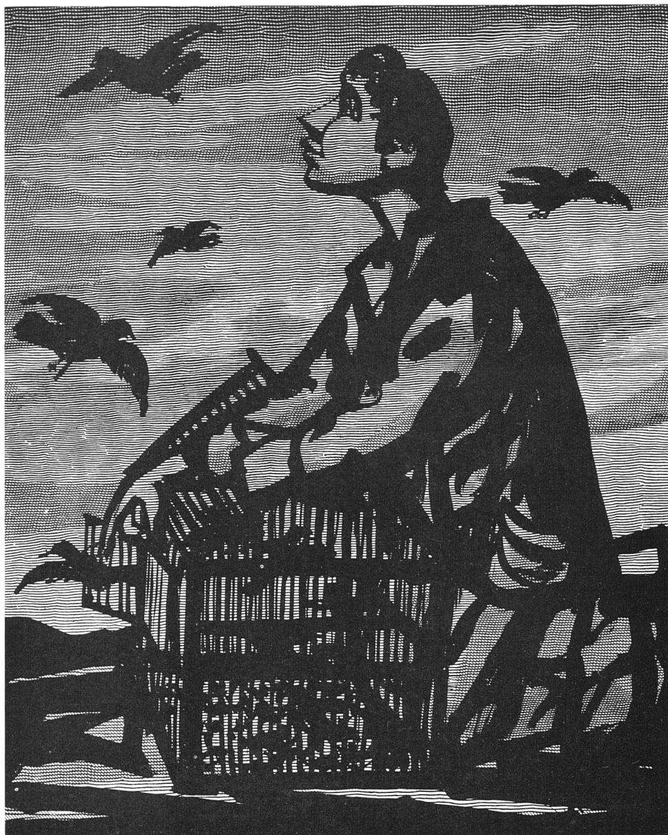
Max Hunziker, Zürich. Illustrationen zu «Thyl Ulenspiegel»

Absichtlich so aufgestellt sind, dass sie kilometerweise talauf- und -abwärts jeden denkbaren Durchblick zerstören, jeden zarteren Reiz erdrücken. Einmal bestimmt wird die Menschheit diese Zeugnisse eines seelenlosen Zeitalters einfach nicht mehr ertragen. Das besagt aber nicht, wir wollten die Belange des Gastgewerbes und der erholungsbedürftigen Menschheit um einer ästhetischen Laune willen in den Wind schlagen. Betrachten wir die Dinge uns einmal ganz materiell! In die gereinigten Bezirke würde eine Art Gäste strömen, welche bisher fortblieb, wie feinere Pflanzen aussterben, wo die Luft zu dick und vermenschlicht wird. Vielleicht sind diese Gäste in Krisenzeiten die zuverlässigere Kundschaft als die vergänglich geldgesegneten internationalen Unkulturapostel! Bergferien: