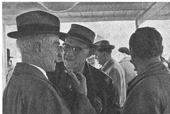
Unser erster Vorsitzender und weitere SWB-Prominenz