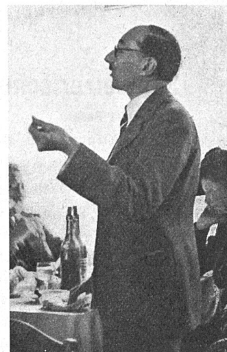
Die Grüsse des «Oeuvre» — und die Diskussion eines Briefes — am Mittagessen in Murten