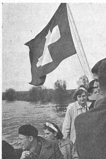
Im Canal de Broye, zwischen Neuenburger- und Bielersee