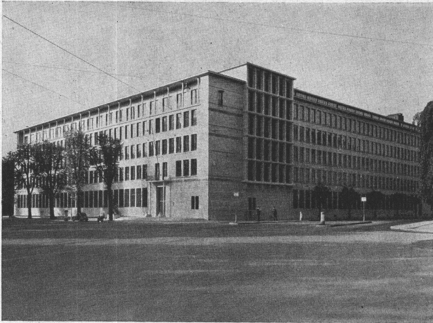
Schweizerische Lebensversicherungs- und Rentenanstalt Zürich Architekten: Gebr. Pfister, Zürich

Terrassenbeläge zirka 1000 m 2 Isolation der Kellerräume gegen Grundwasser zirka 4500 m 2