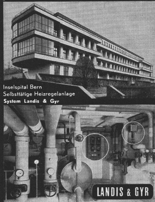
Inselspital Bern Selbsttätige Heizregelanlage System Landis & Gyr

dosiert die Heizleistung selbsttätig nach der Witterung. Sie passt sich den Erfordernissen jeden Heizbetriebs an und gestattet sparsamste Brennstoff-Verwendung.