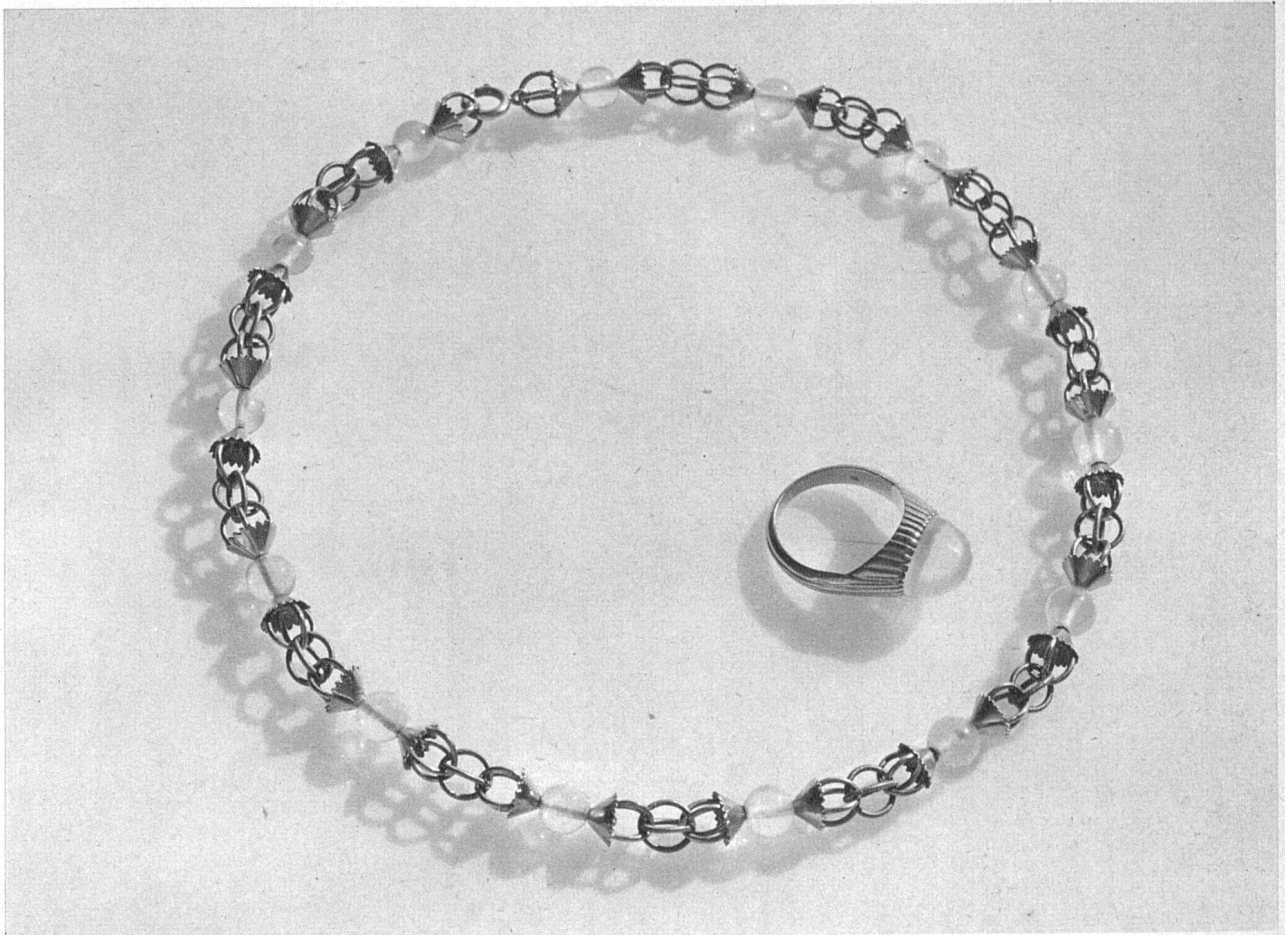
Ring und goldene Kette mit weissen Mondsteinen