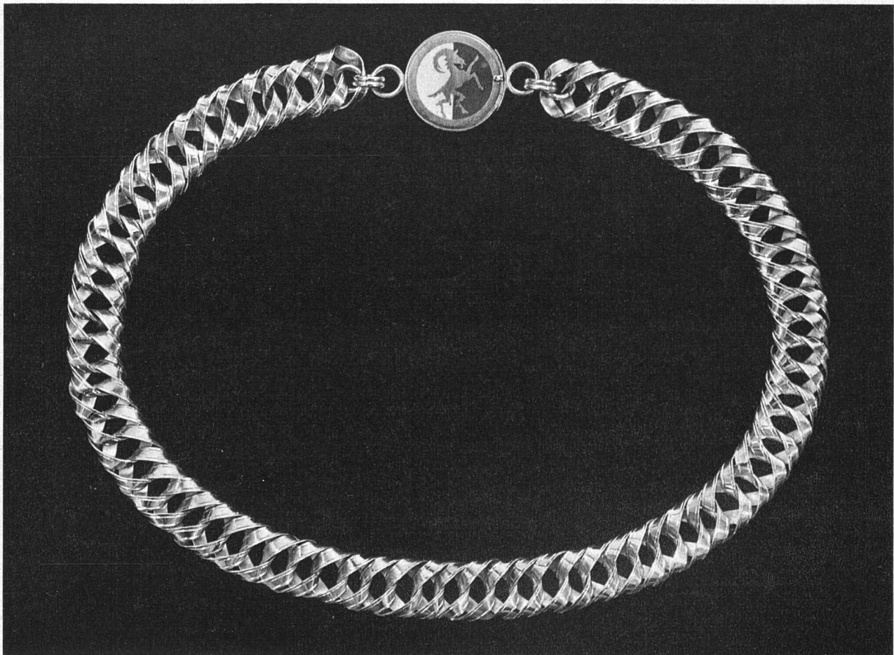
Goldene Kette, Schloss blau-weisses Email