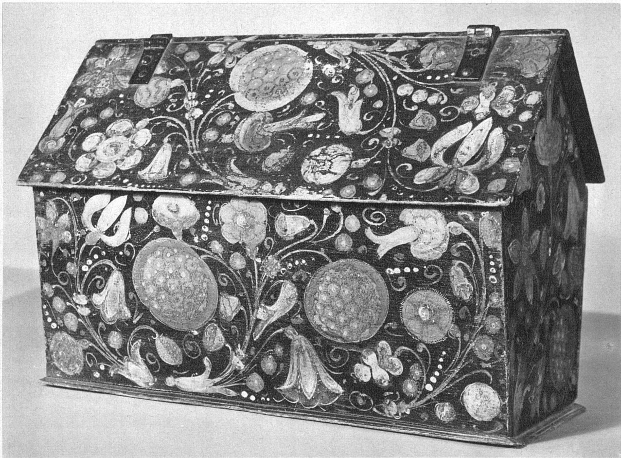
Schweiz. Landesmuseum, Zürich