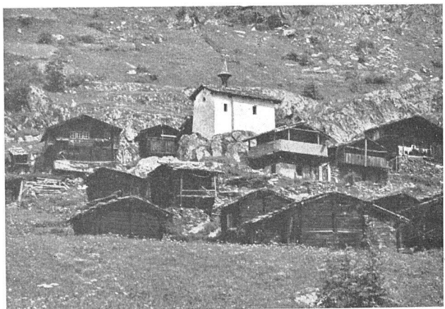
Eisten im Lötschental. Das Raumbedürfnis der Alpkapelle wäre ohne Schwierigkeit im Holzbau zu befriedigen; aber die Kapelle soll etwas ganz anderes sein als die Wohnhäuser.