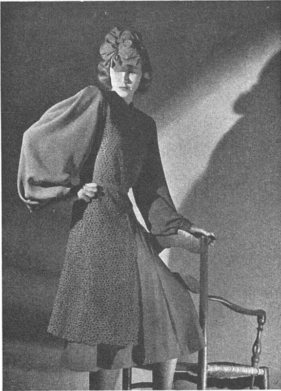
Nachmittagskleid aus schwerem, reinseidenem Crêpe von Stehli & Co., Zürich. Mantel aus geätzter Guipurestickerei von Walter Schrank, St. Gallen.

ten. Hierbei spielte der Stoffdruck die Hauptrolle, daneben erschienen gewobene Streifen und Karos in besonders geschmackvoller Auswahl. Bedruckter Chintz darf hervorgehoben werden; ferner gab es leichte glatte und bestickte oder mit netten kleinen Mustern durchwobene Tüllarten für Vorhänge. Zu erwähnen ist auch das Schweizer Heimatwerk mit vorzüglichen Wollstoffen, etwas handgewobenen Seidenstoffen und einigen schön bestickten Blusen.