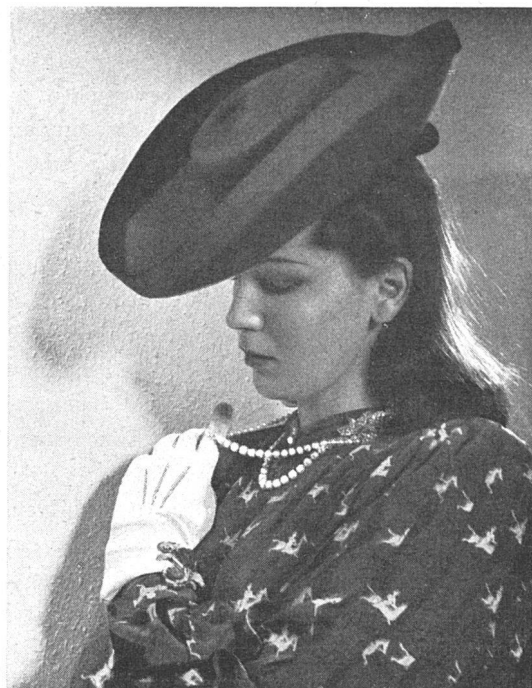
Nachmittagskleid aus kunstseidenem, bedrucktem Crêpe Iris der Seidenstoffwebereien vorm. Gebr. Naef AG., Zürich. Hutgeflecht aus Wohlener Stroh. Kleid und Hut: Modelle Gaby Jouval. Schmuck: Perlenkette und Brillantklips von E. Gübeline, Zürich-Luzern.