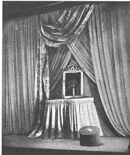
Vom Schaufensterwettbewerb der Ersten Schweizer Modewoche, Zürich. Links und Mitte: Schaufenster der Firma PKZ Burger-Kehl & Co. AG., Herrenkonfektion, Zürich (1. Rang); rechts: Schaufenster der Firma Tapeten-Spörri, Zürich (1. Rang).