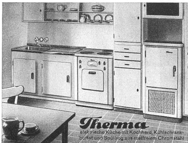
Therma elektrische Küche mit Kochherd, Kühlschrank, buffet und Spülrog aus rostfreiem Chromstahl

Bahnhofstrasse 18, Zürich Gleiches Haus in St. Gallen