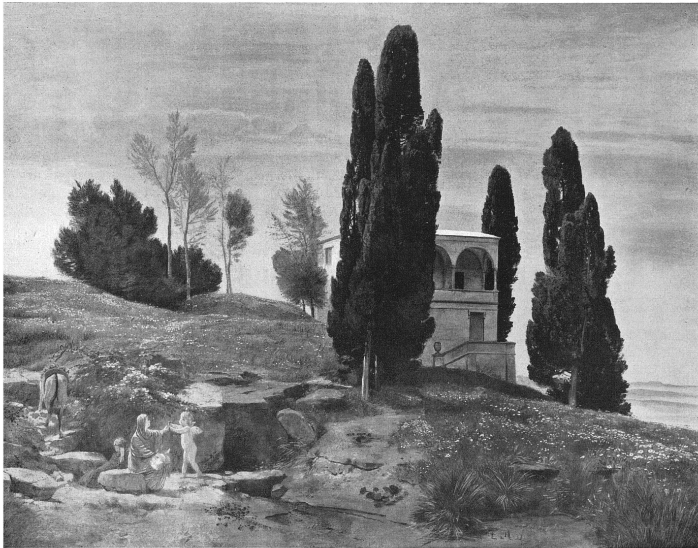
Arnold Böcklin Frühlingslandschaft Fresko des Sarasinschen Gartensaales