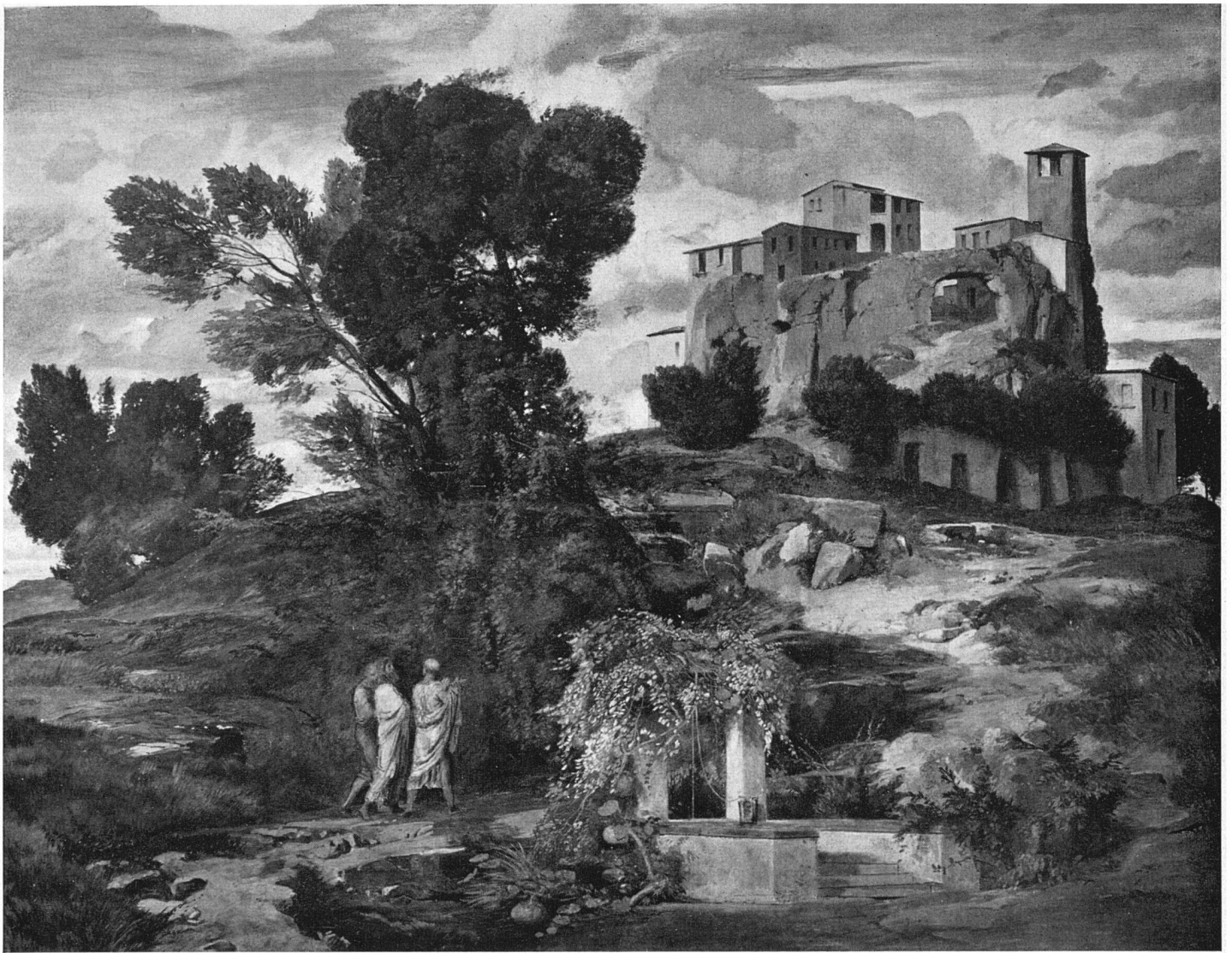
Arnold Böcklin Gang nach Emmaus Fresko des Sarasinschen Gartensaales

Luft. Erst das Licht aus weißem Kalk und Hell-Ocker (es sah in der Mischung etwas zu gelb aus, doch meinte Böcklin « das trockne schon kreidig auf »), dann einen Mittelton für die Dunstwolken, endlich den blauen Luftton, der etwas dunkler als die graue Grundfarbe war. Dann begann er die Luft, setzte die Lichter energisch auf und malte schließlich die Stellen, wo man den blauen Himmel sah. Darauf malte er die Ferne, dann das Haus und ganz leicht das von der darüberstehenden Sonne beschienene glänzende Dach. Endlich die Zypressen, so dunkel als möglich.