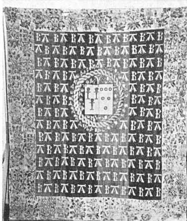
Tapiserie aux Initiales de Robert Chabot et de sa femme Antoinette d'Illiers (XV e )