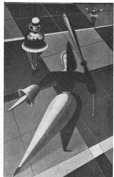
Das Triadische Ballett. Abb. aus «Die Bühne im Bauhaus». Bauhausbücher, Band IV, 1925.

Paul Klee, James Joyce, Louis Marcoussis, Robert Delaunay, Sophie Täuber-Arp starben in den letzten Jahren. Verschiedene Persönlichkeiten, verschiedene Intensitäten, aber doch darin sich gleichend, daß sie seit Jahrzehnten an einer neuen künstlerischen Sprache, an einer kommenden Zeit kompromißlos, standhaft und unbe-