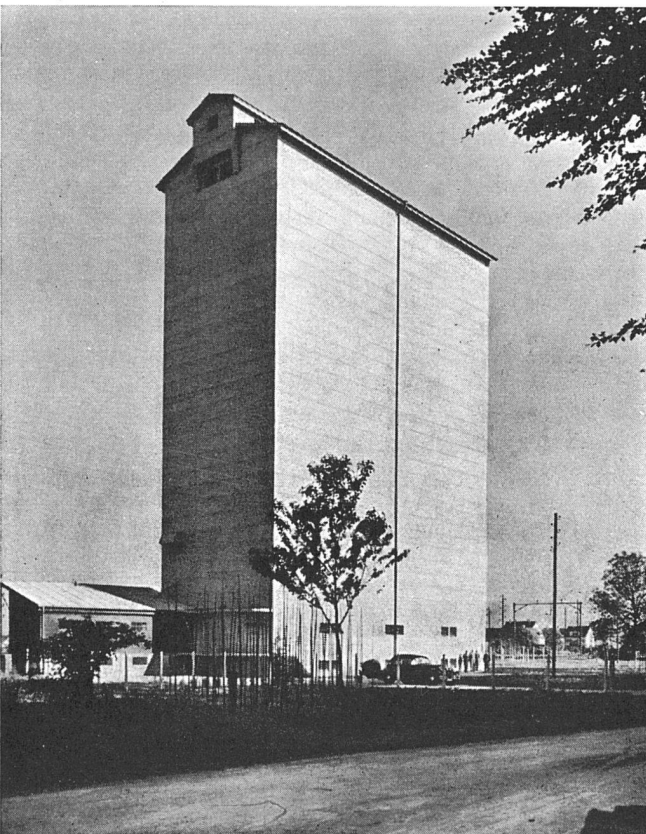
Neuer Silo der Neumühle Töb Ing. Büro A. Wickart & Co., Zürich

FERMETAL AG. für Metalldichtungen ZÜRICH, Sihlstraße 43 Telephon 3 90 25