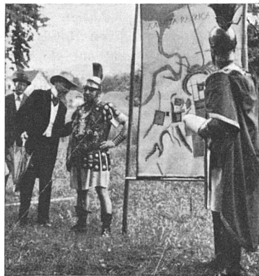
Der Stadtplan von Augusta Raurica wird diskutiert