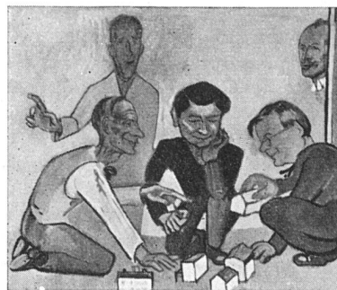
Will Ziri s'fachlig Kenne vo den Architektschetzt, Isch jeden amllig Poschte guet mit B-S-A-Lytt bsetzt