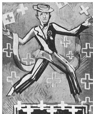
« Si spile mit Basler Altstadt-Staibaukletzli »

« Kai Kryzlischwemmi ihm geniegt - Kai Ertli, wo kai Fähnli fliegt - »