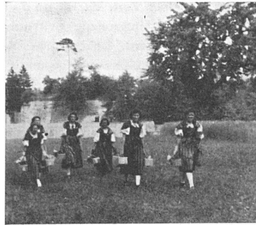
Der BSA in Augst. Ehrenjungfern bringen die von der Regierung Baselland kredenzten Kirschen

Auf alle Fälle war nun das aufgescheuchte Bankettvölkchen richtig orientiert über all die Fragen, die da unter dem grünen Rasen schlummern. Es mußte nun aber noch dem grauen «Barebli» folgend, sich die verzwickte Baugeschichte des Theaters anhören, um dann, vom dritten Rang aus, unerwartet, offenbar durch Oboenklänge angelockt, einen Satyr auftreten zu sehen, eine leibhafte, antike Vasenfigur, die da unten ihre Faxen trieb, und dann noch vier und noch vier und noch vier ihresgleichen. Wer sein übriggebliebenes Schulgriechisch zusammenraffte, mochte da und dort einen Brocken erwischen aus dem rhythmischen Singsang des munteren Spieles. So schnell wie er aufgetaucht war, war auch der Spuck wieder verschwunden, was zurückblieb war die reichbewegte Landschaft ins heroische gesteigert durch die römischen Ruinen, aufs reichste und schönste aber belebt durch unsere munter und bunt durcheinander sich bewegende Gesellschaft. So fand die Basler BSA-Tagung in Augst ihren Abschluß. H. B.