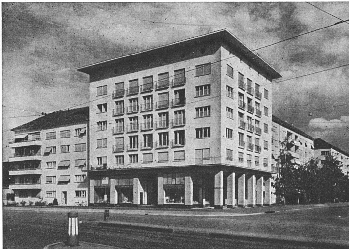
Geschäftshäuser „Zum Korn“ (Gem. Ausf.)