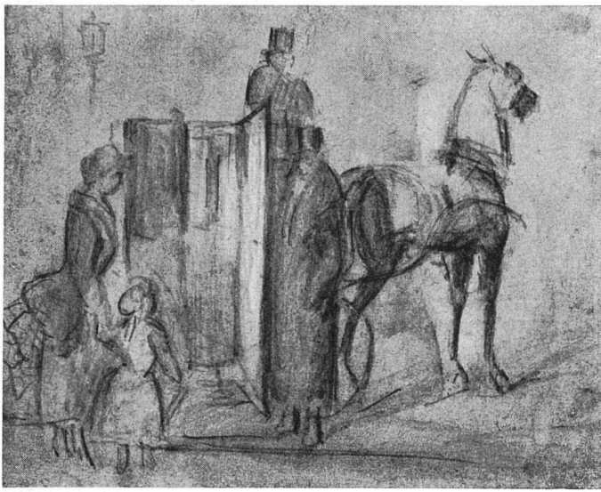
Guys La calèche , Zeichnung laviert, teilweise Feder

Jeder männliche Zylinder, jede weibliche Robe, jeder Fächer, jede Uniform, jeder Steigbügel ist ihm, als Attribut einer Menschenart, ein solches Ding.