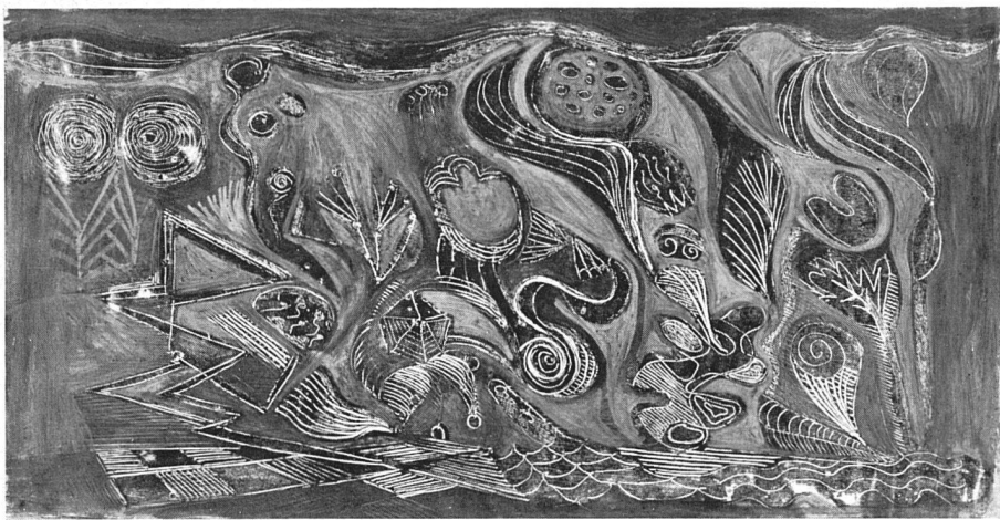
Serge Brignoni Projet pour peinture murale 1940