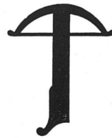
Schweizer Ursprungszeichen Entwurf Steinmann & Bolliger SWB