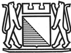
Zürcher Stadtwappen Entwurf E. Keller