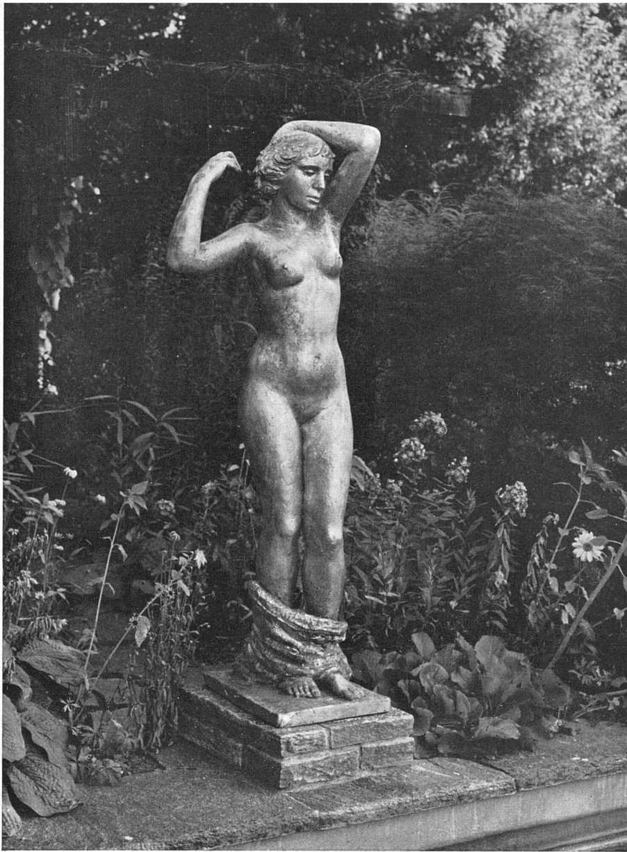
Hermann Hubacher «Badende» Bronze (blattvergoldet)

stellung in einer Nische oder in einem architektonischen Gehäuse, Aufstellung unter einem Baldachin, Profilierung durch eine glatte oder strukturierte Wand. Von allen diesen architektonischen oder dekorativen Sicherungen bleibt in einem Garten im allgemeinen nur der Sockel bestehen, und in vielen Fällen wird auch er aufgehoben. An die Stelle dieser sichernden Voraussetzungen treten in der Gartenarchitektur allerdings andere, mit denen jeder, dem auf diesem Gebiet eine Aufgabe gestellt wird, zu rechnen hat – und auch rechnet: bewegtes oder einfaches Gelände, Struktur des Gartens, Aufteilung der Flächen, ebener oder terrassierter Boden, abschließende oder aufteilende Mauern, Blumenbeete,