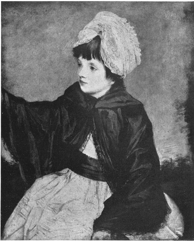
Josuah Reynolds Lady Isabella Howard