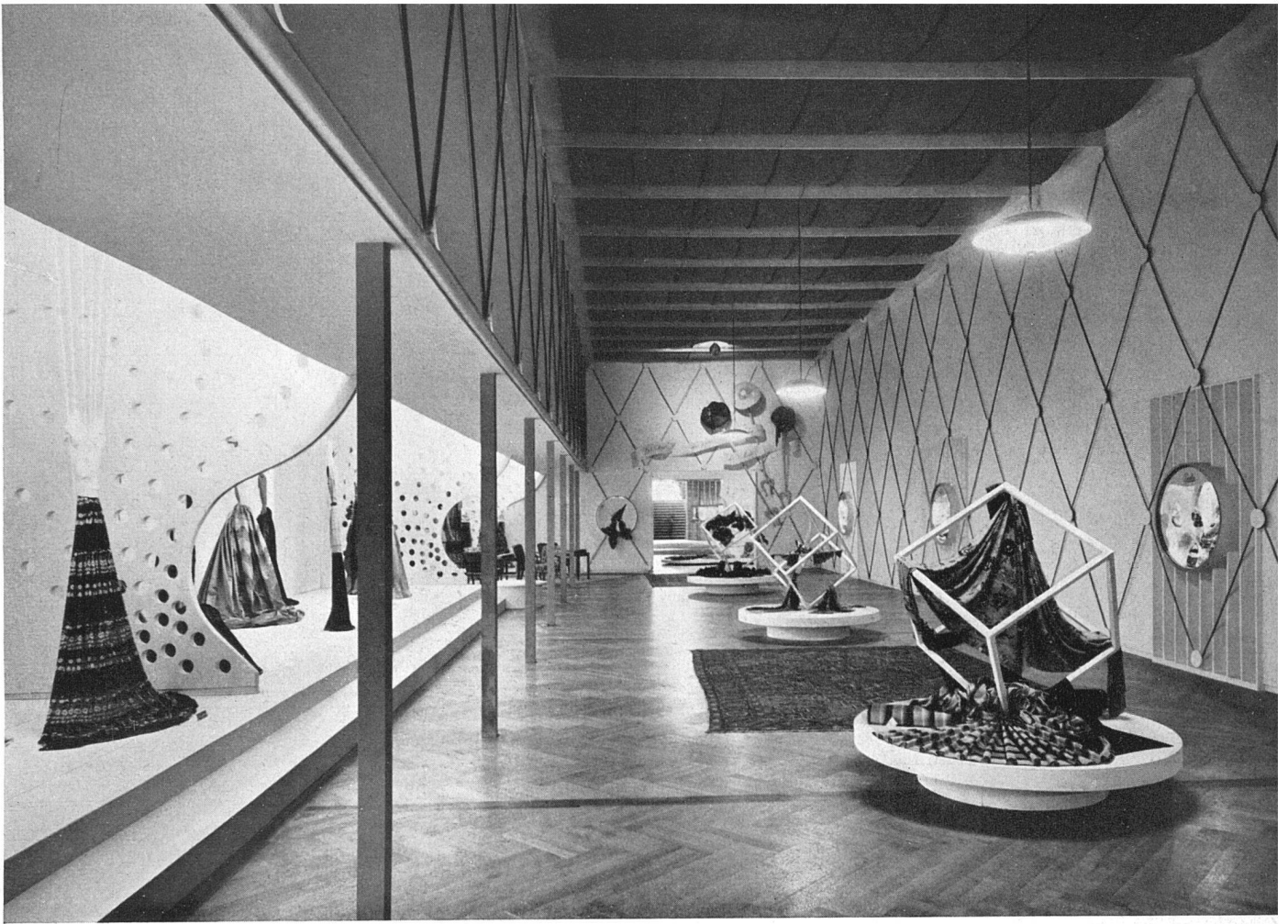
Ausstellungsraum (10) «Seide» Einzelausstell