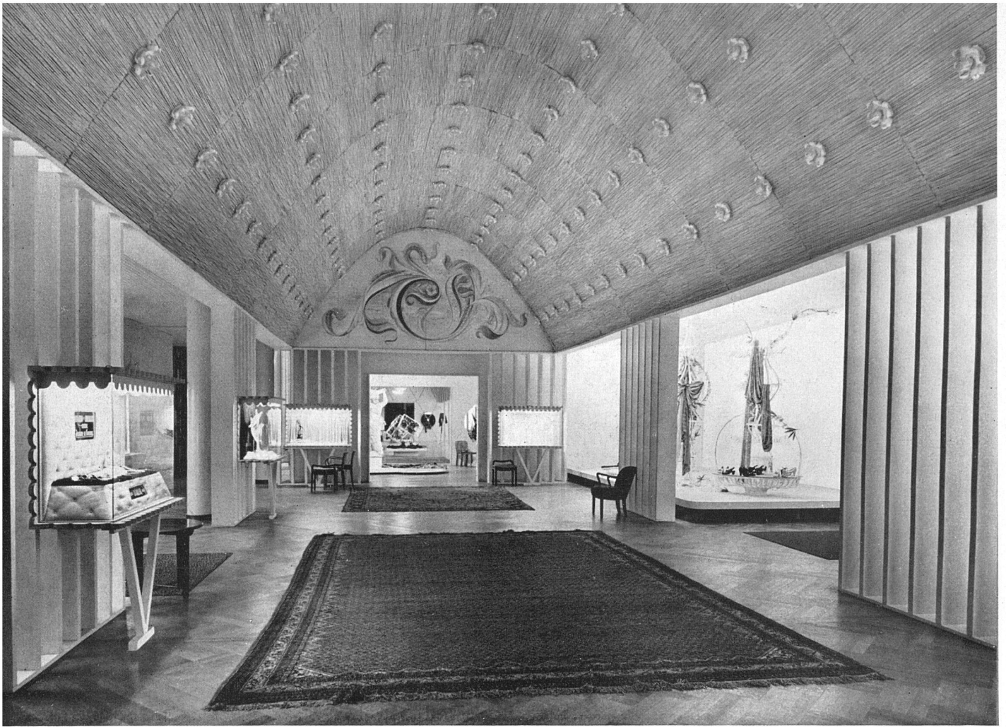
Vorraum Kongreßsaal (12) Uhren, Schmuck, Repräsentative Modevorführungen