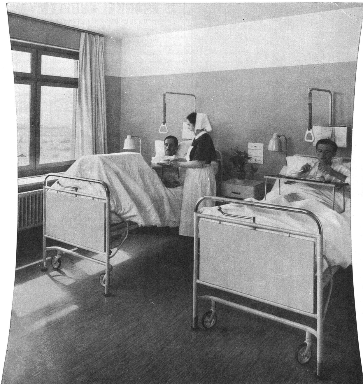
Hebebetten mit neuer Hebelanordnung über dem Fußbrett