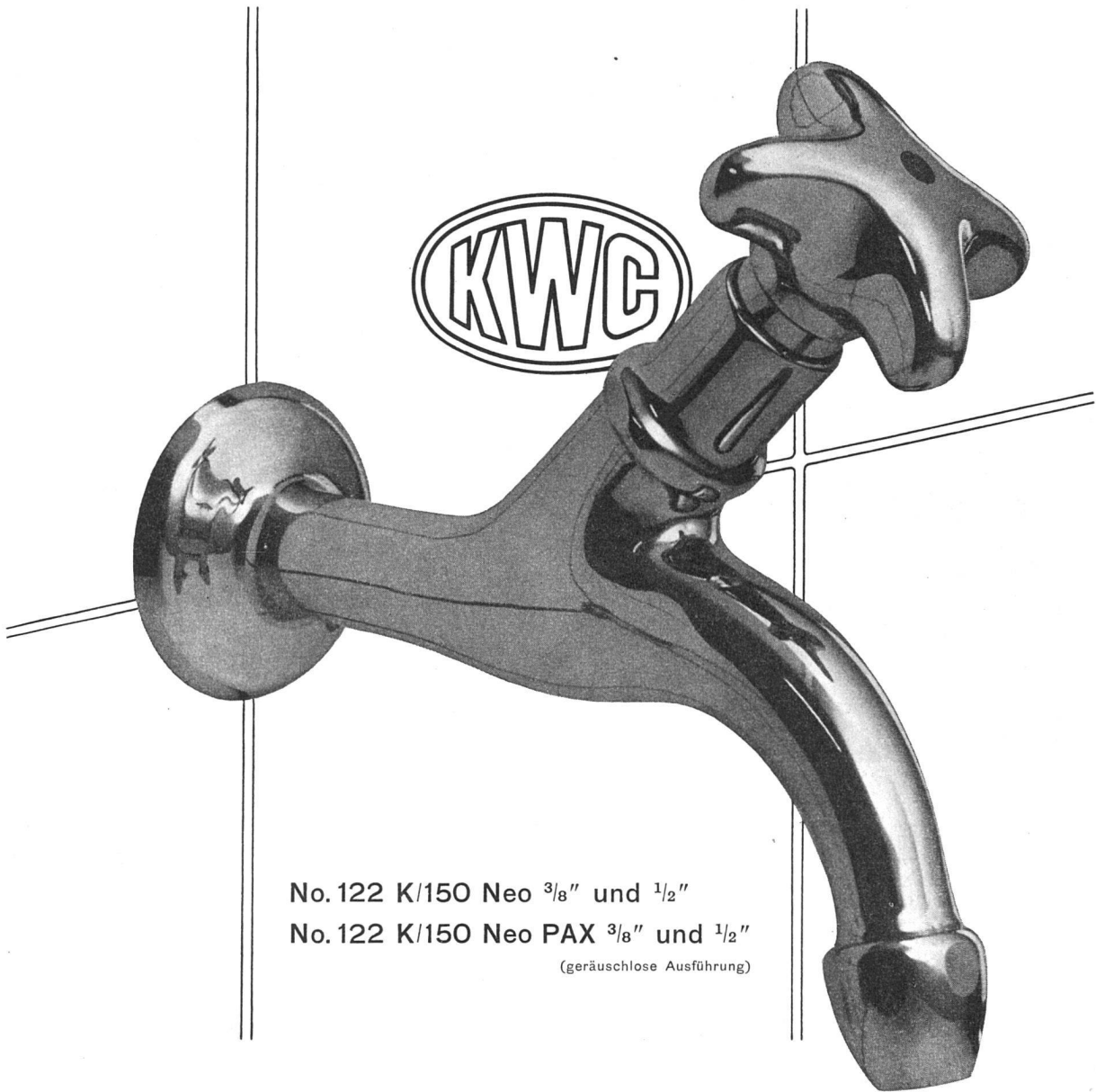
No. 122 K/150 Neo \frac{3}{8} " und \frac{1}{2} " No. 122 K/150 Neo PAX \frac{3}{8} " und \frac{1}{2} " (geräuschlose Ausführung)