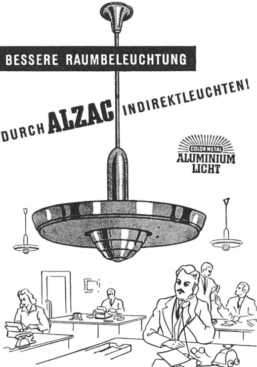
Nr. 7701, 60 cm Ø