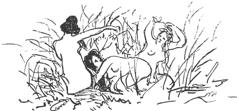
Manet Holzstichvignette aus L'Après-midi d'un faune Probedruck Neuerwerbung des Basler Kupferstichkabinetts