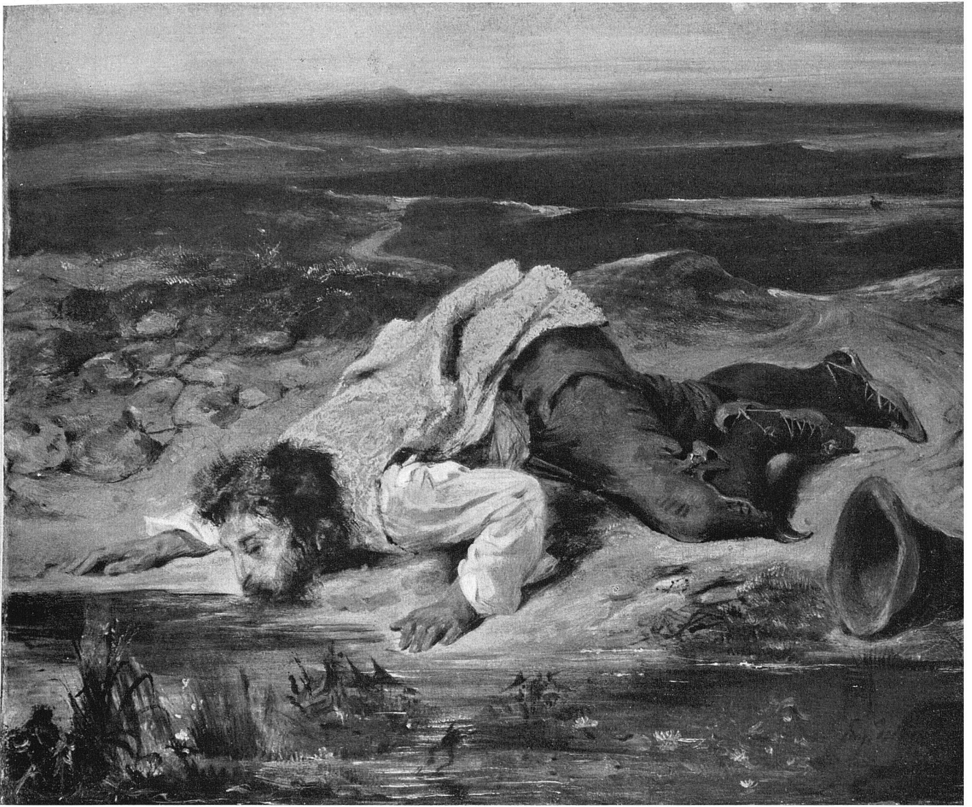
Öffentliche Kunstsammlung Basel