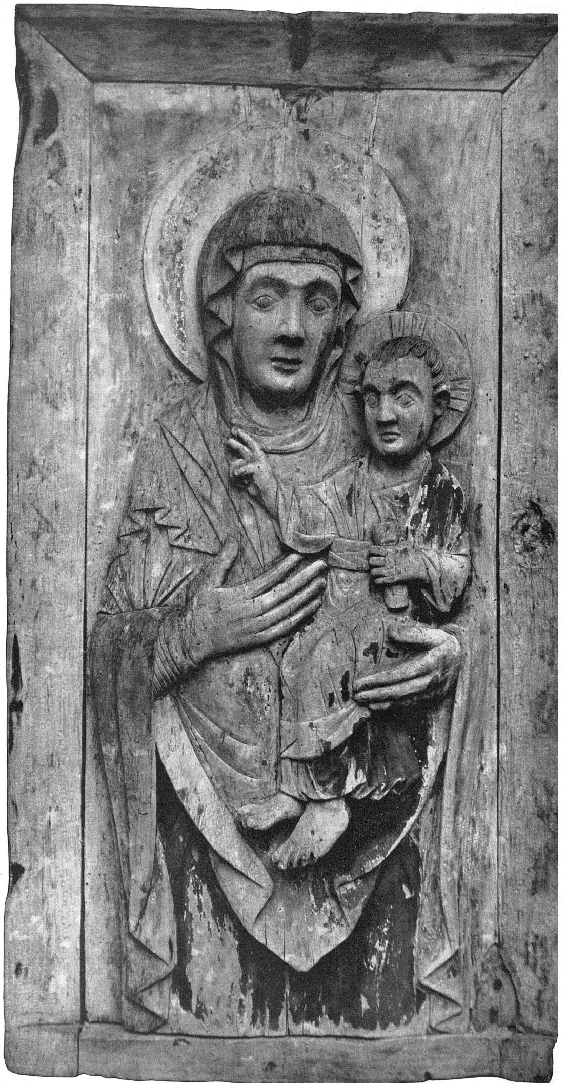
Maria mit Kind Spätromanische Holzskulptur aus Obervaz, Kt. Graubünden Öffentliche Kunstsammlung Basel