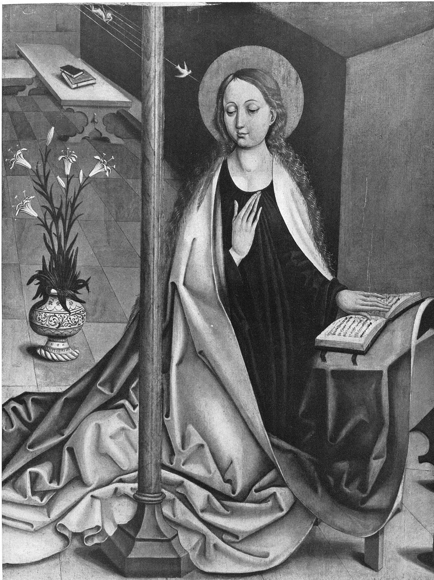
Öffentliche Kunstsammlung Basel